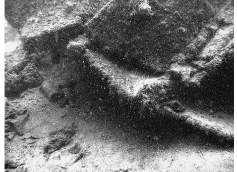
Afb. 4 - De afgescheurde scheepswand

Van de bakboord sectie (afb. 3) zijn de resten van de scheepswand, spanten en dekconstructie, hoewel sterk verwrongen, nog goed te herkennen. Met name de twee achterste zware dwars-schotten zijn sterk naar achteren weggebogen. De dikke scheepswand (afb. 4) en het dek (afb. 3) lijken in de lengterichting te zijn opengescheurd. Vermoedelijk is deze schade aangericht door bergers (mogelijk op zoek naar de scheepsschroef) uitgerust met zwaar materieel of springstof.