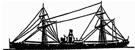
Afb. 1 - De enige bekende afbeelding van de Mediator

De Mediator is een 19 de eeuws zeilstoomschip (afb. 1) dat in dezelfde eeuw in de haven van Willemstad gezonken is. Het moment van haar ondergang is goed gedocumenteerd [2] , maar wat dieven en bergers later aangericht hebben is niet duidelijk. Bovendien is het wrak bedekt met heel veel afval uit alle tussenliggende periodes.