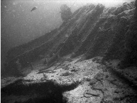
Afb. 3 - Bakboord sectie van het wrak

Het wrak is om haar lengteas gekanteld over een hoek van bijna 30° waarbij de stuurboord sectie geheel onder het sediment terechtgekomen is.